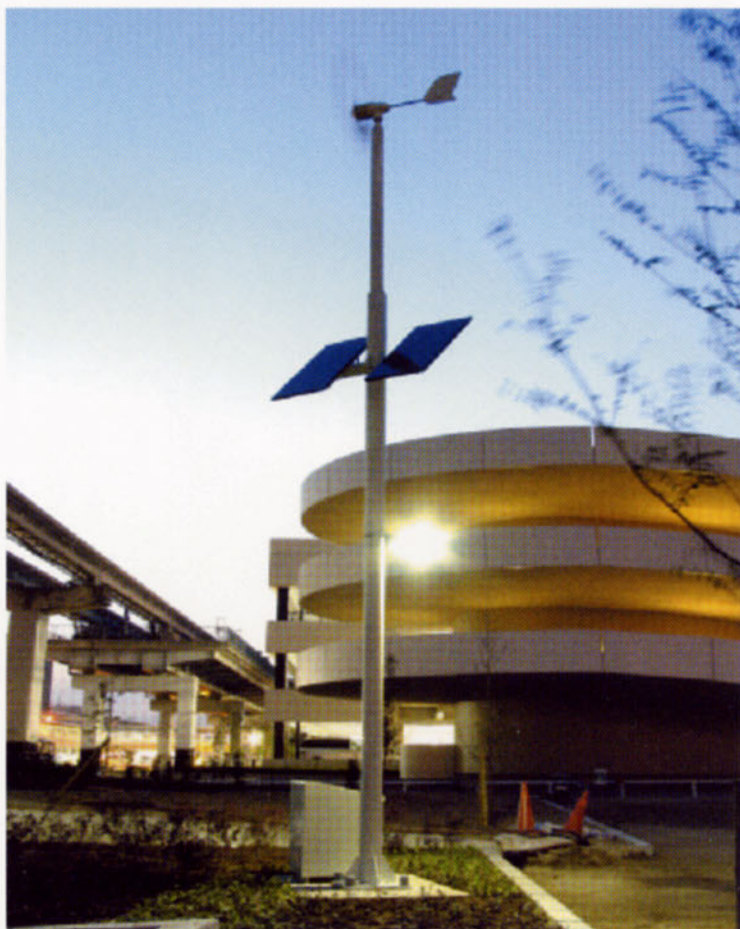
大阪伊丹空港公園 (施主:国土交通省)

■ NEP-HI (公共用) 性能アップ。街路灯1基につき子機2基の併用が可能です。